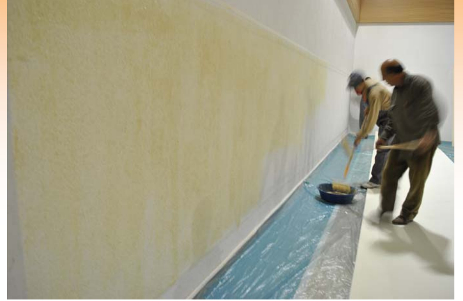
Duvara yapıştırıcı uygulaması yapıldı.