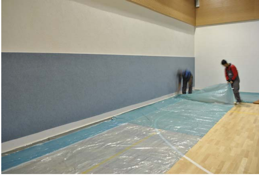
Duvar minderi uygulandı, ve naylon koruma örtüsü kaldırılmaya başlandı.