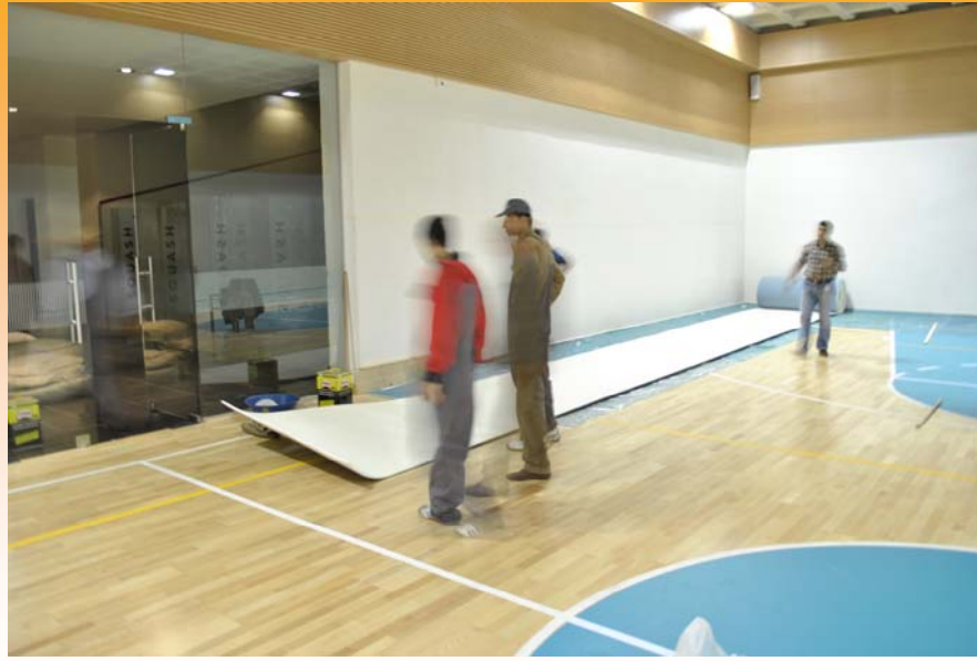
Duvar minderi açılıp serildi, uygulamaya hazır hale getirildi.